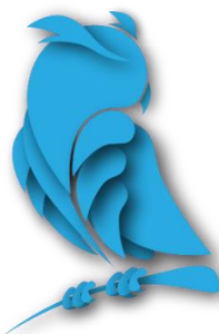
Рис. 1 Оформление рисунков и иллюстраций. Рисунки только в формате .jpg